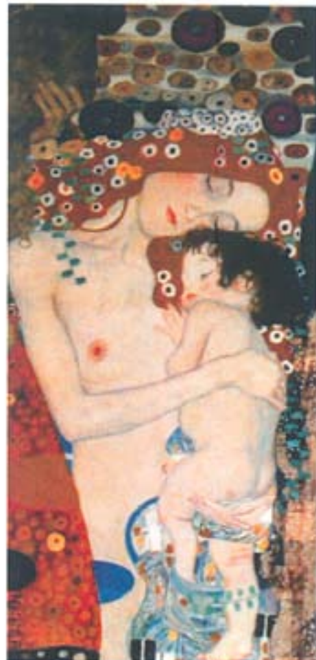
DELEGACION GENERAL UPCN LOTERIA NACIONAL S. E.