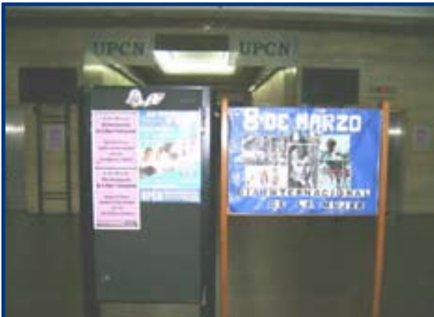
DELEGACION GENERAL UPCN INDUSTRIA Y COMERCIO