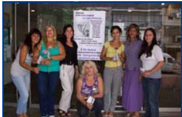
DELEGACION GENERAL UPCN INET