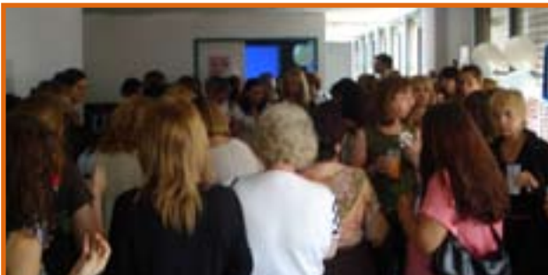
DELEGACION GENERAL UPCN SUPERINTENDENCIAS (SSALUD- APE)