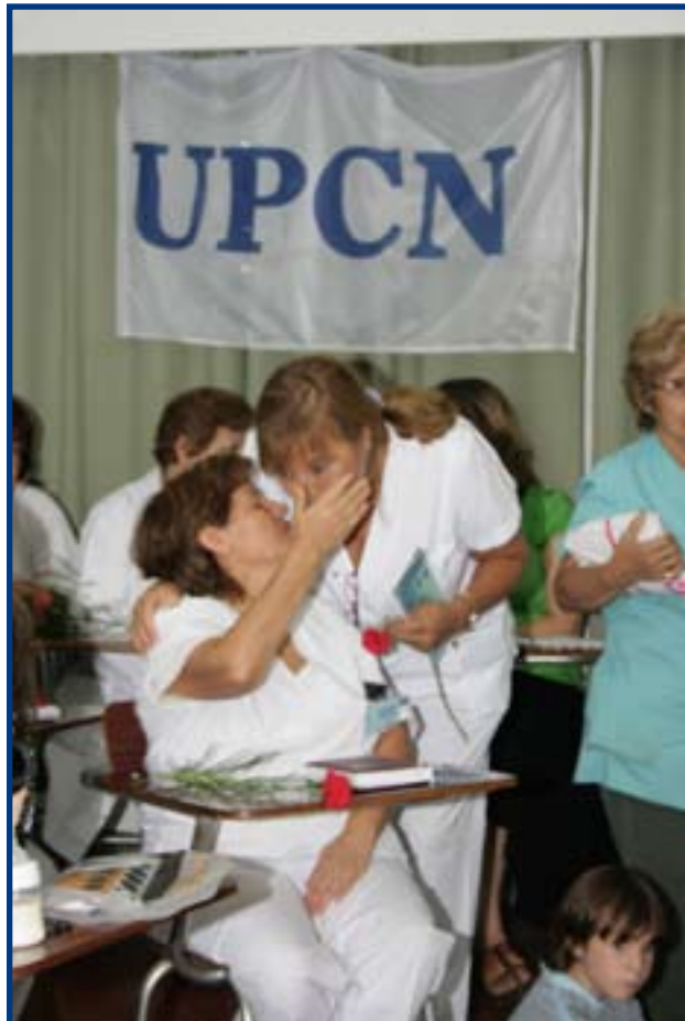
DELEGACION GENERAL UPCN HOSPITAL GARRAHAN