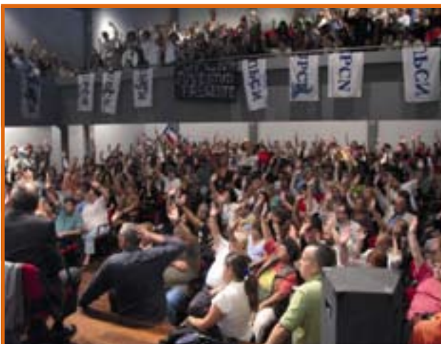
DELEGACION GENERAL UPCN PAMI