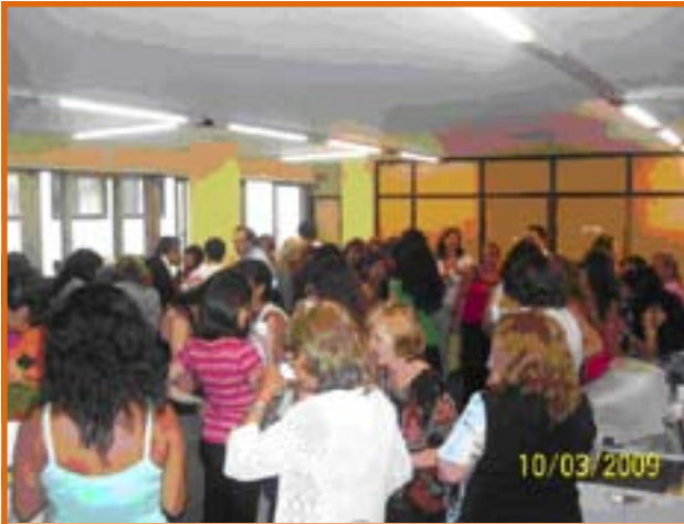
DELEGACION GENERAL UPCN COMISION NACIONAL DE REGULACION DEL TRANSPORTE (C.N.R.T)

En el marco de la conmemoración del Día Internacional de la Mujer, las delegaciones gremiales, una vez más, estuvieron con las/las trabajadoras/es a través de distintas actividades. En este sentido, destacaron la lucha incansable que viene realizando la UPCN, en busca de una efectiva Equidad de Género e Igualdad de Oportunidades y de Trato.