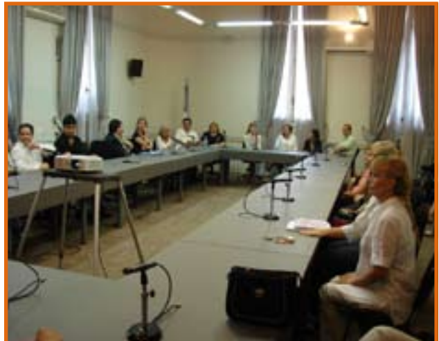
DELEGACION GENERAL UPCN MINISTERIO DE EDUCACION