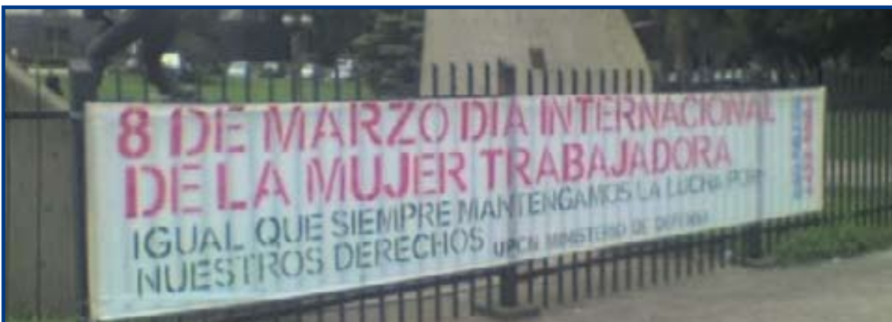
DELEGACION GENERAL UPCN MINISTERIO DE DEFENSA