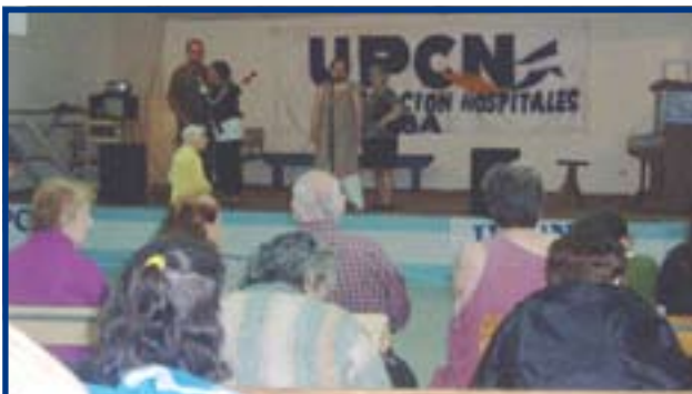
DELEGACION GENERAL UPCN HOSPITALES GCBA