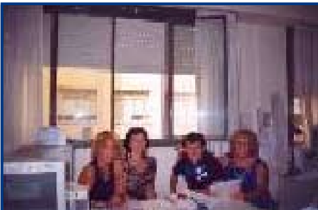
DELEGACION GENERAL UPCN ANSES

Recorrida en los Organismos, homenaje a las compañeras y entrega de presentes