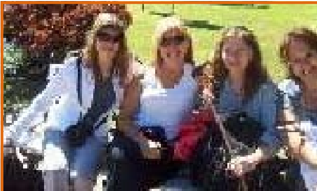
DELEGACION GENERAL UPCN REGISTRO NACIONAL DE LA PROPIEDAD DEL AUTOMOTOR Y CRÉDITOS PRENDARIOS